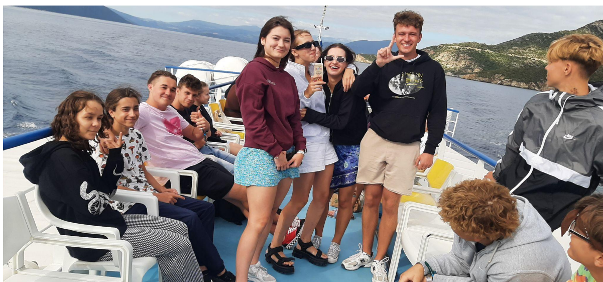
Podczas rejsu statkiem mieli okazję nauczyć się greckiego tańca narodowego “Sirtaki”.